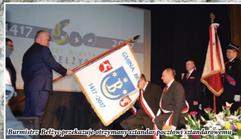
Burmistrz Bełżyc przekazuje otrzymany sztandar pocztowi sztandarowemu