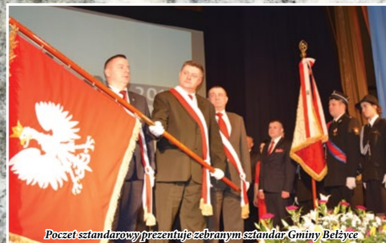
Poczet sztandarowy prezentuje zebrany sztandar Gminy Bełżyce