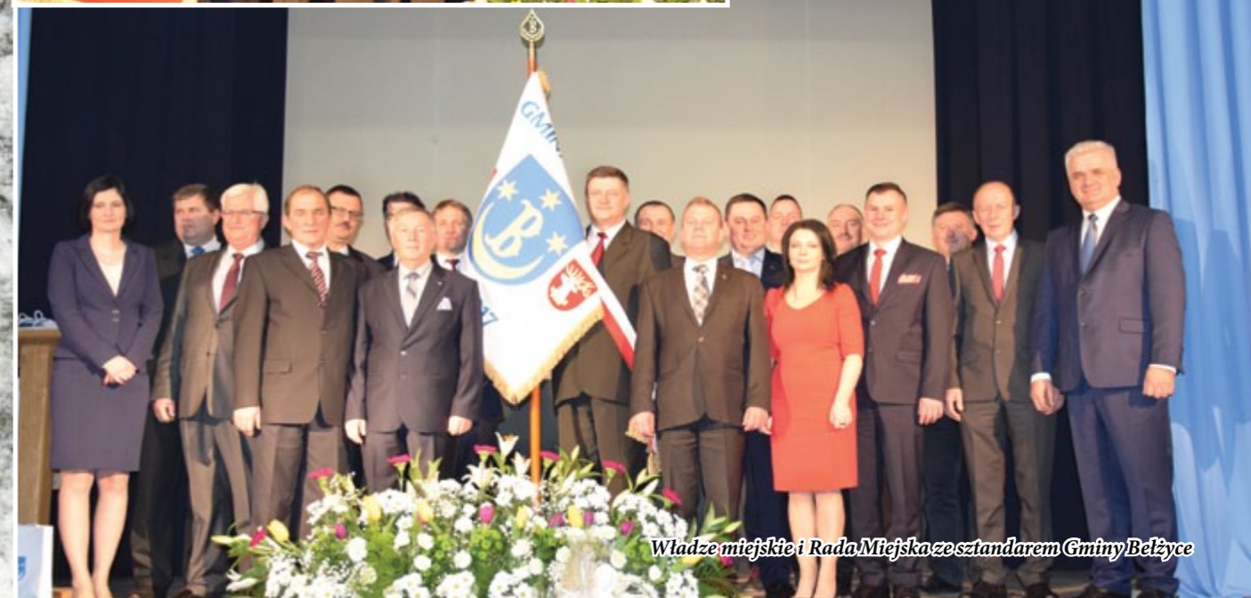
Władze miejskie i Rada Miejska ze sztandarem Gminy Bełżyce