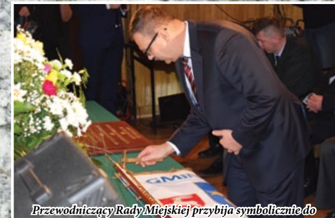
Przewodniczący Rady Miejskiej przybija symbolicznie do drzewca sztandaru imienny gwoździec