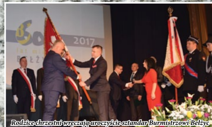
Rodzice chrzestni wręczają uroczystie sztandar Burmistrzowi Bełżyc