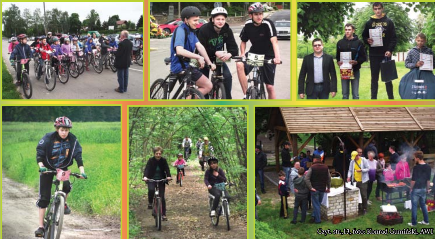
Czyt. str.13, foto: Konrad Gumiński, AWI