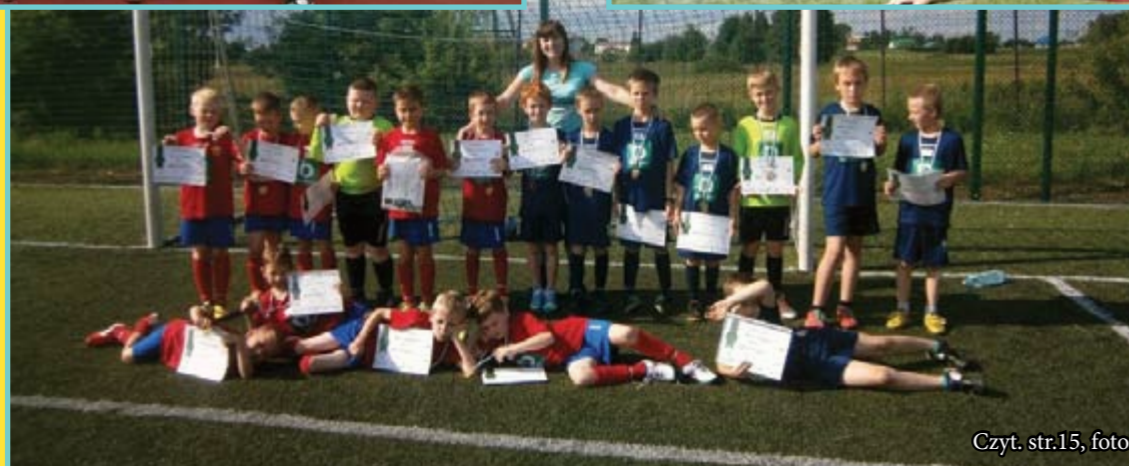
Czyt. str.15, foto: Justyna Giza