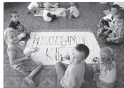
Malucholandia w Krzu