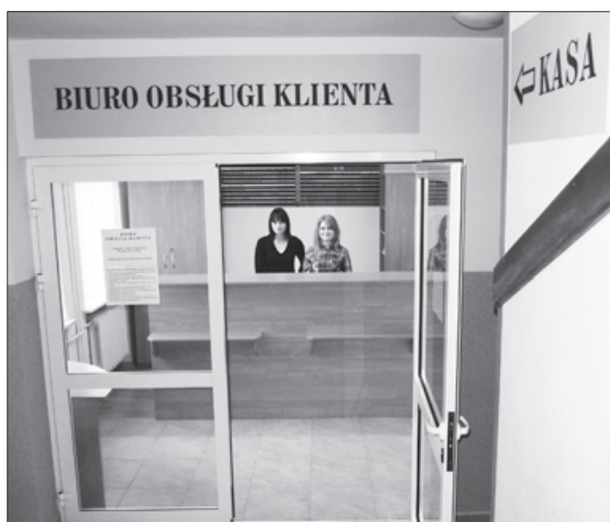
Biuro Obsługi Klienta w Urzędzie Miejskim

Gmina Bełżyce otrzymała dotację ze środków Państwowego Funduszu Rehabilitacji Osób Niepełnosprawnych przekazaną przez powiat lubelski na doposażenie i stworzenie miejsca pracy dla osoby niepełnosprawnej. W ramach przyznanego wsparcia został zakupiony m.in. samochód marki Hyundai, dla potrzeb gminy Bełżyce i jej jednostki organizacyjnej - Ośrodka Pomocy Społecznej.