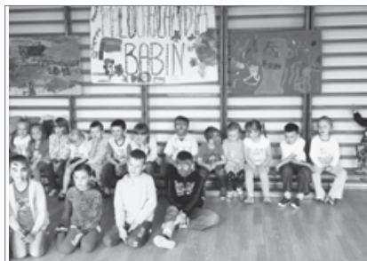
Malucholandia w Babinie