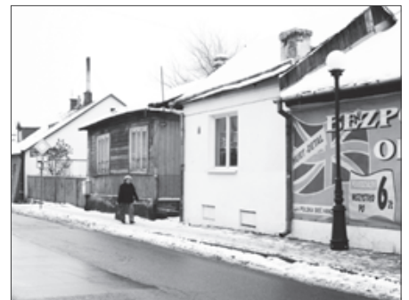
Na ulicy Zielonej postawiono lampy uliczne, które oświetlają drogę od Rynku do ulicy Krakowskiej.