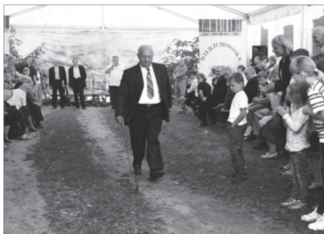
Turniej Sołectw - część rozrywkowo-integracyjna