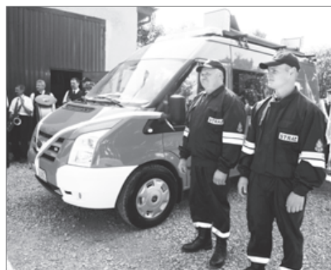
65 lat OSP Kolonii Chmielnik i przekazanie nowego wozu strażackiego