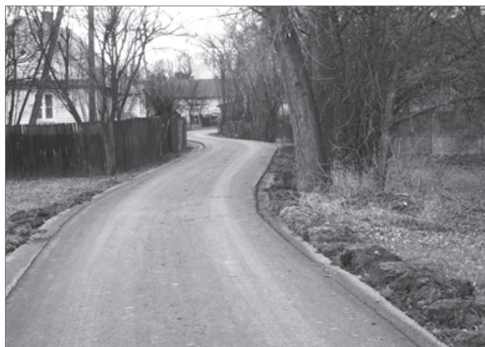
Droga w Malinowszczyźnie