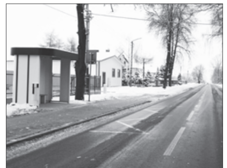
W Babinie stanęły nowe wiaty przystankowe, docelowo będzie ich pięć.