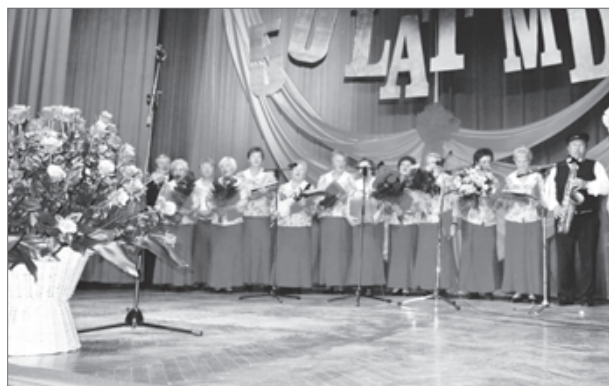
50 lat Miejskiego Domu Kultury w Bełżycach