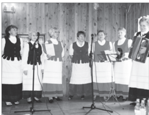
25 lat Zespołu Śpiewaczego z Wojcieszyna