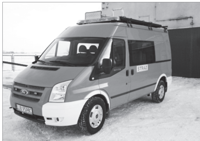
Samochód strażacki OSP Babin