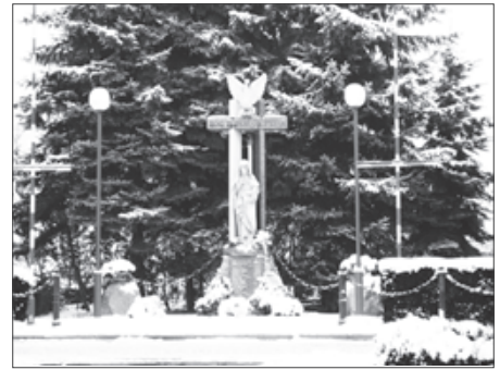
Przy pomniku Matki Boskiej Partyzantek zamontowano lampy, które wieczorem oświetlą monument.