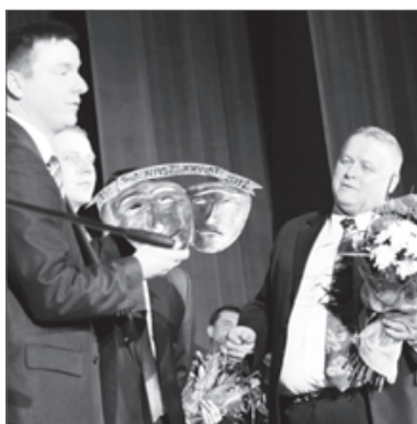
25 lat Teatru Nasz