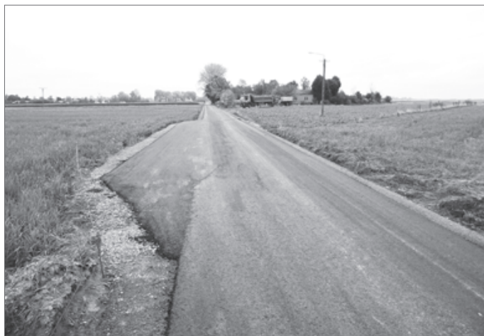
Droga Kierz - Kukawka