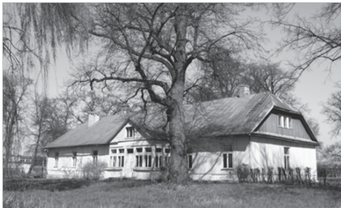
Obecny widok na dworek w Krężnicy Okrągłej