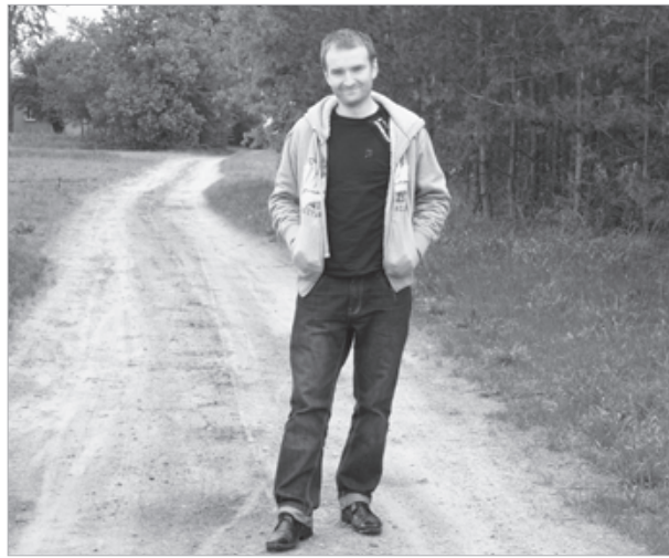
Droga łącząca Zalesie z Wierchowiskami Górnymi i Starymi nie ma jeszcze nawierzchni asfaltowej

Kolejną sprawą są dzikie wysypiska śmieci. jedno z nich powstaje za tzw. placem buraczanym, tam gdzie kiedyś było wysypisko. - Czy z przyzwyczajenia ludzie wysypują tam śmieci, czy też w nocy przyjeżdżają specjalnie i podrzucają... - zastanawia się radny - Jest to problem, który musimy rozwiązać - podsumowuje. W związku z pozbywaniem się odpadków mimo podpisanych umów na