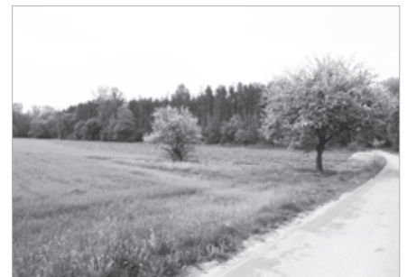
Malownicza okolica Wierchowisk

W okręgu wyborczym Pachuty szczytą się przede wszystkim działalnością