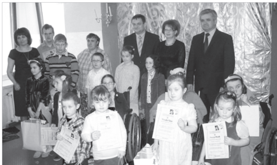
Nagrodzeni w konkursie otrzymali oprócz dyplomów także nagrody rzeczowe

Tekst: Izabella Ponieważ, Edyta Wojtaszko