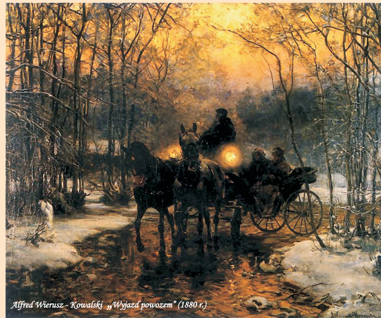
Alfred Wierusz - Kowalski „Wyjazd powozem” (1880 r.)

poniedziałek - piątek w godz. 8.00 – 16.00