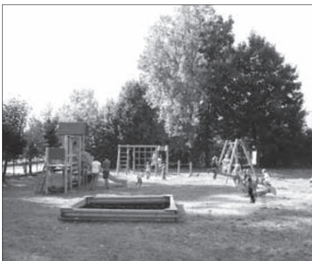
Bezpieczne i bez troskie miejsce zabaw