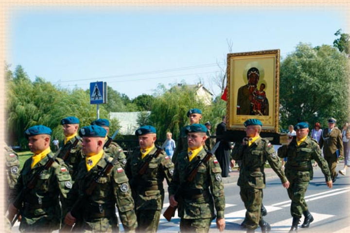
Uroczystości patriotyczne - sierpień