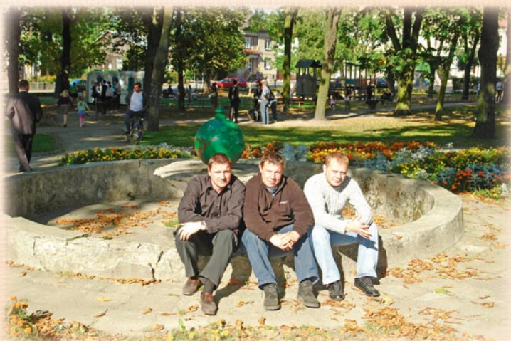
Stara fontanna dosłownie na kilkanaście godzin przed rozpoczęciem budowy nowej...