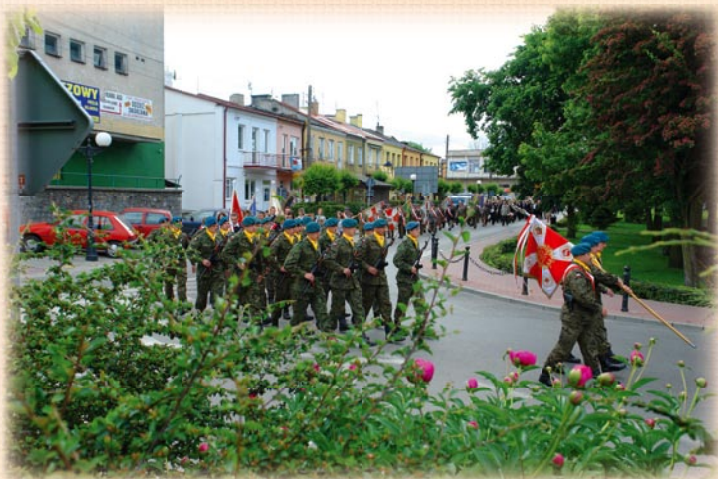
Uroczystości patriotyczne – czerwiec