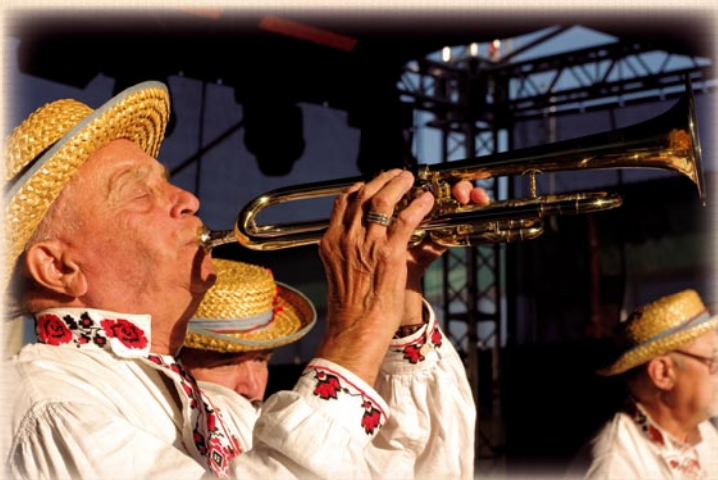
Bełżycką Fajarę 2009 wręczono najpierw w czerwcu – kapele, a następnie we wrześniu – orkiestry