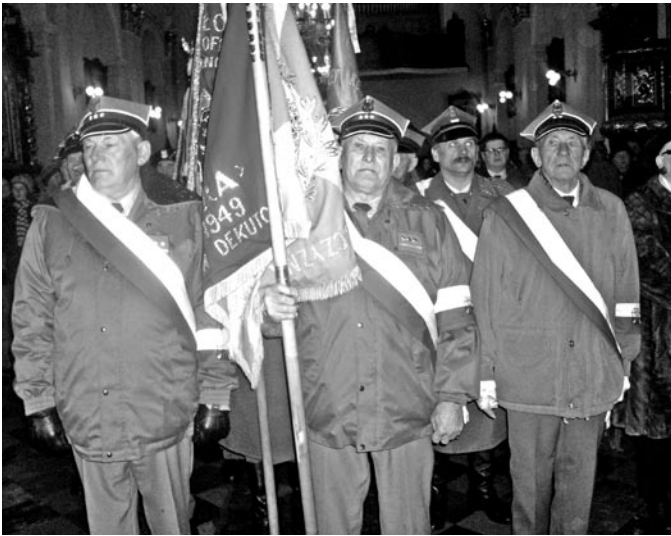
Na zdjęciu poczty sztandarowe