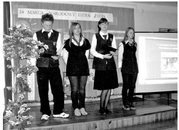
Występ uczniów szkoły podstawowej i gimnazjum z ZS nr 2 w Bełżycach

(w artykule wykorzystano informacje zawarte w Uchwale Sejmu Rzeczypospolitej Polskiej, z dnia 27 sierpnia 2004 r.)