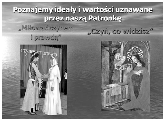
Prezentacja uczennic ZS nr 2 w Bełżycach

Rodzina Szkół noszących imię Świętej Królowej Jadwigi ogłosiła ogólnopolski konkurs na prezentację multimedialną pt. „ Królowa Jadwiga – patronka mojej szkoły ”. Organizatorem konkursu była Szkoła Podstawowa nr 21 im. Królowej Jadwigi w Lublinie. Celem konkursu było szerzenie wśród dzieci postaw moralnych Patronki, jak również pogłębianie wiedzy uczniów na temat patronki szkoły, kultywowanie pamięci o patronce, integracja społeczności szkolnych ze szkołami noszącymi imię Pani Wawelskiej oraz doskonalenie umiejętności informatycznych. Każda drużyna miała przygotować prezentację multimedialną, w której przedstawiała ideały i wartości reprezentowane przez Patronkę, życiorys Królowej Jadwigi, a także tradycje szkolne związane z Patronką.