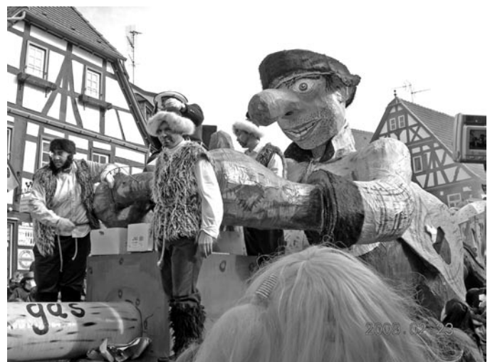
„Różany Poniedziałek” w Seligenstag