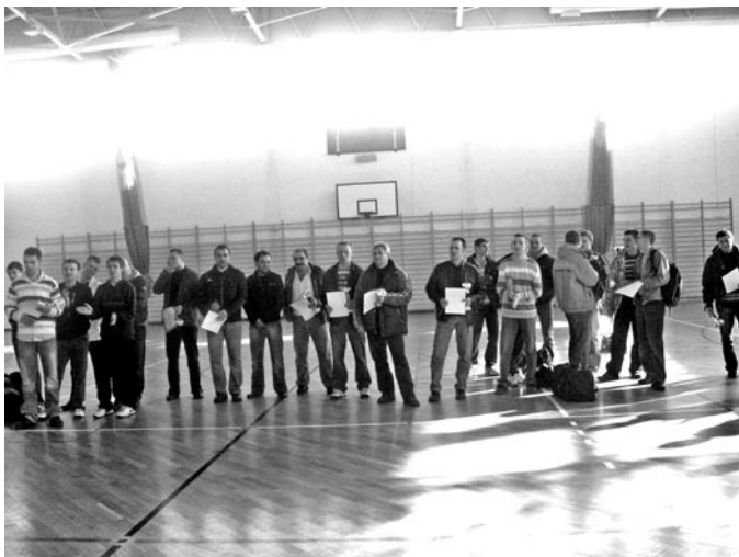
Najlepsi z najlepszych – uczestnicy rozgrywek piłki halowej

Drużyny Art Gips Kraśnik oraz Perła Man Borzechów uzyskały awans do I ligi, natomiast Rolplast i Stara Dama spadły do II ligi w następnym sezonie.