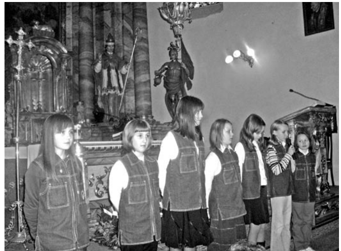
Uczennice kl. IV b z ZS nr 1 w Bełżycach w trakcie występu