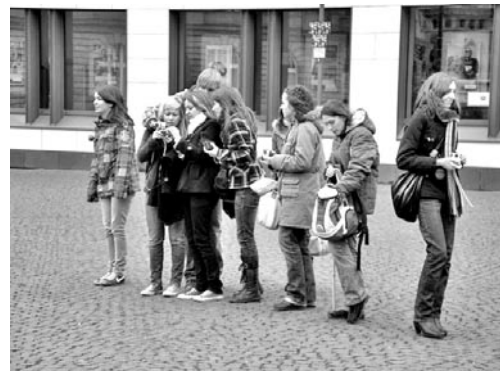
Na zdj. uczniowie ZS im. M. Kopernika w Niemczech