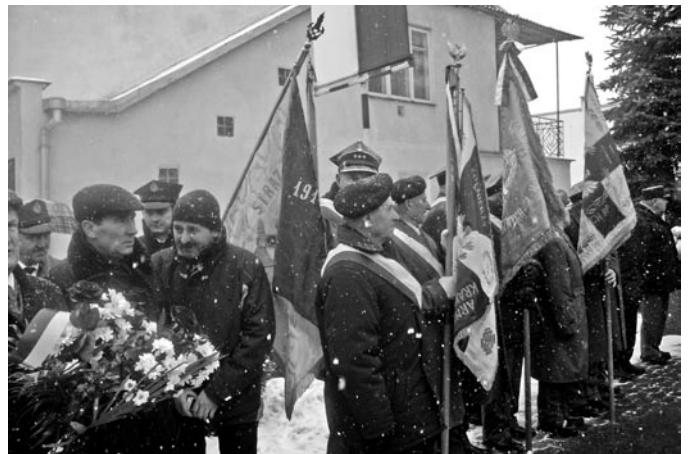
Poczty sztandarowe oraz mieszkańcy Bełżyc przy Pomniku Matki Boskiej Partyzanckiej