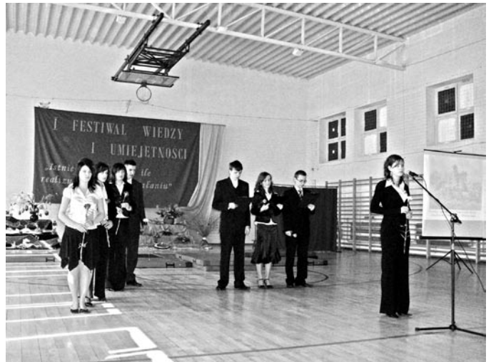
Część artystyczna – na zdj. uczniowie ZST im. T. Kościuszki w Bełżycach