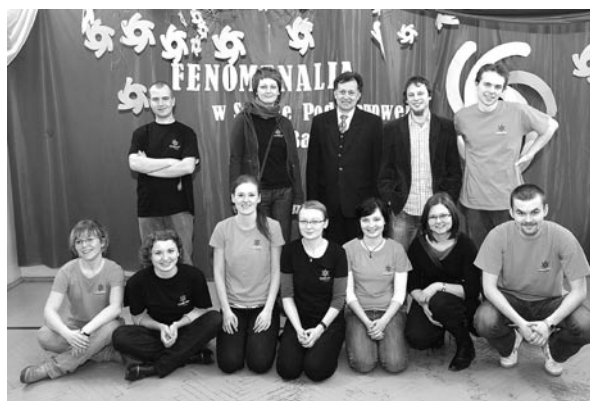
Na zdjęciu studenci lubelskich uczelni – wolontariusze „Projektora”