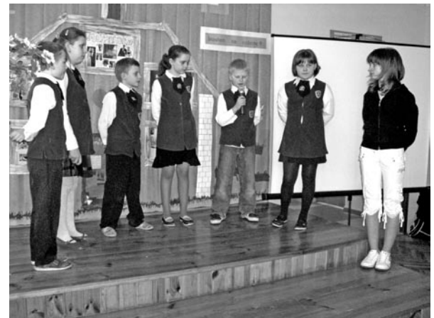
Montaż słowno-muzyczny. Na zdj. uczniowie ZS nr 2 w Bełżycach