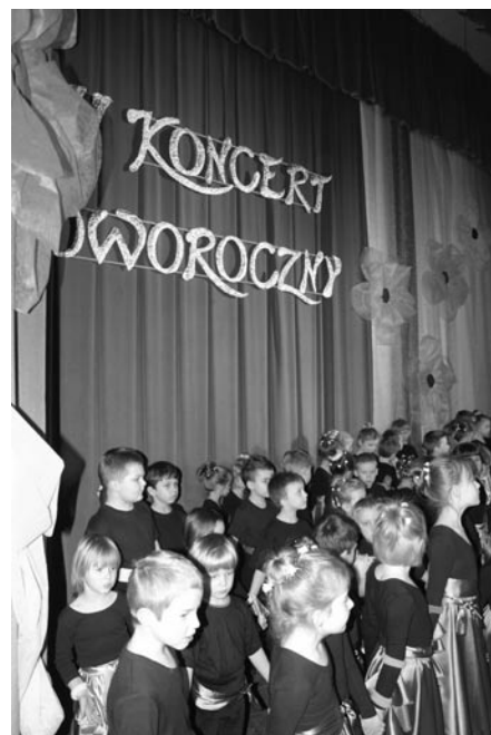
Na zdjęciu przedszkolaki w Koncercie Noworocznym w MDK

Nauczycielki Samorządowego Przedszkola Publicznego w Bełżycach