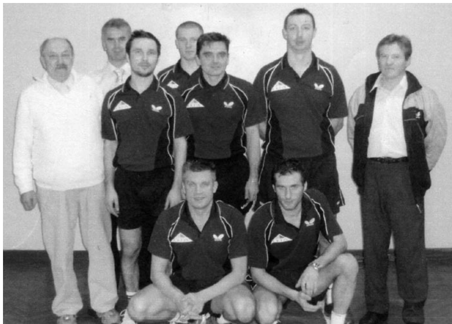
Na zdjęciu drużyna tenisa stołowego mężczyzn CKFiS w Bełżycach Od góry z lewej strony: