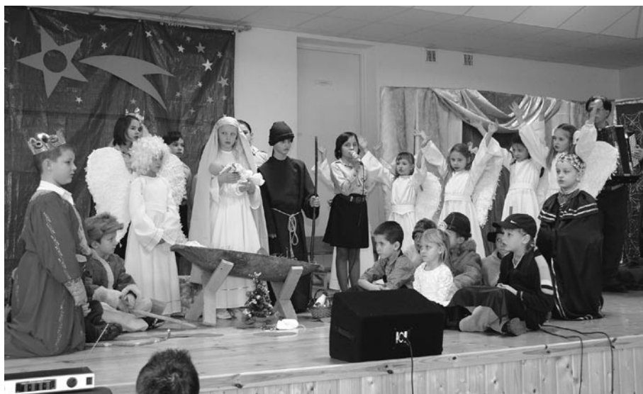
Uczniowie Szkoły Podstawowej w Babinie w przedstawieniu jasełkowym

wie rozmawiali ze sobą dążąc do Betlejem. I tak wkraczamy w krąg teatru, od wieków związanego z Bożym Narodzeniem. Różne były jego formy – bogate i ubogie, ludowe. Cel jednak był