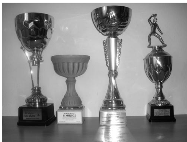
Puchary drużyny tenisa stołowego mężczyzn