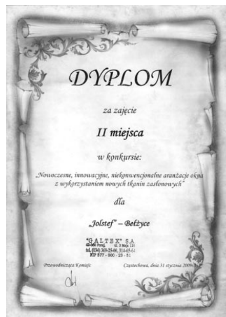
Dyplom dla firmy Jolstef za zajęcie II miejsca w konkursie

Należy podkreślić, że bardzo duży udział w naszych sukcesach mają nasi długoletni pracownicy, którzy bardzo chętnie uczestniczą w różnych szkoleniach, podnosząc tym samym swoje umiejętności i prestiż firmy, w której są zatrudnieni.