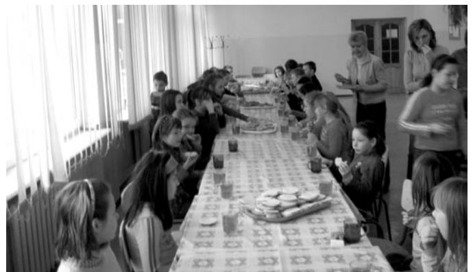
II śniadanie uczniów, przygotowane przez Panie kucharki ZS Nr 1