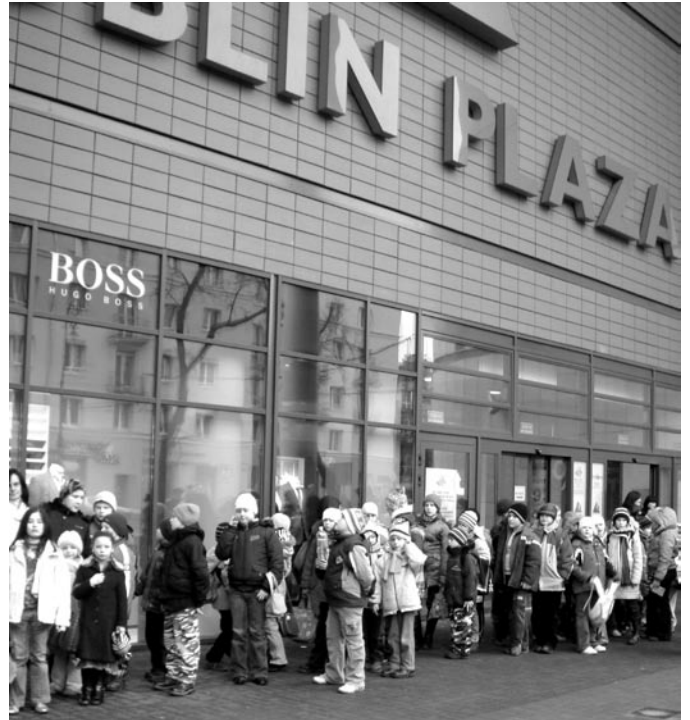
Uczniowie klas I-VI szkoły podstawowej ZS Nr 1 tuż przed seansem filmowym