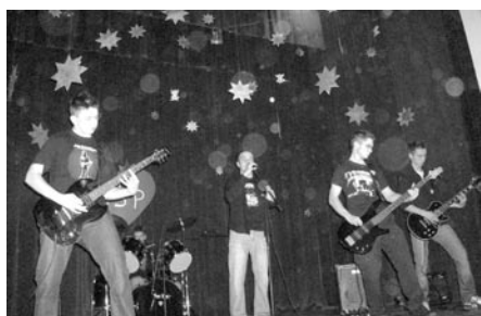
Zespół Transfusion na występach WOŚP w MDK w Bełżycach.