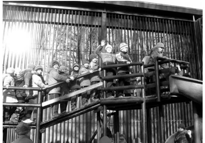
Na placu zabaw w Nałęczowie