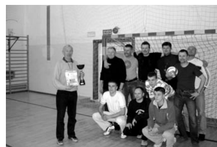
Drużyna z Niedrzwicy